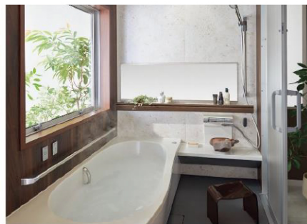
転倒の不安なく入浴をゆったり楽しめる