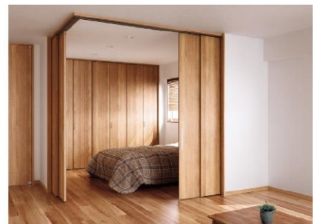
空間が自在に使え、騒ぎの心配も減らせる